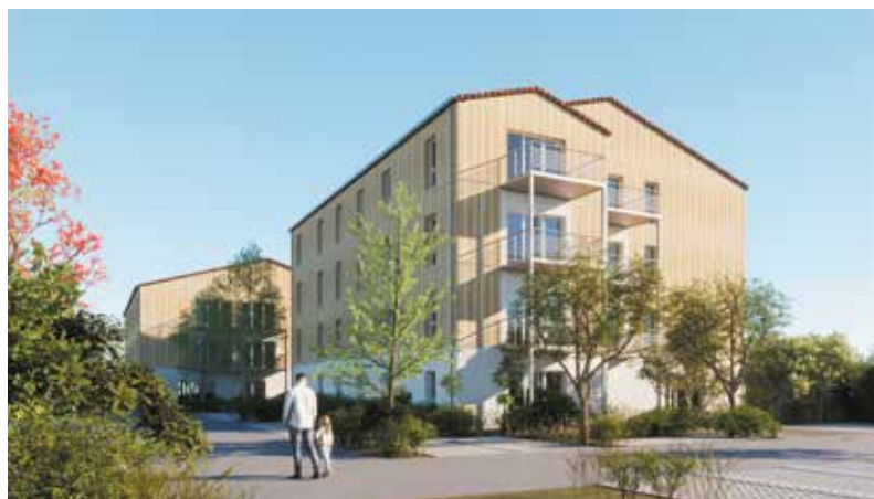
Cabinet d'architecture Arlab architectes

Quel que soit le projet, nos équipes font preuve d'agilité, de souplesse, de rigueur et de créativité.